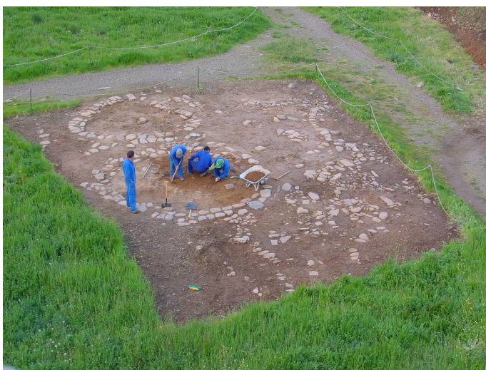
Figura 2 ▶ Pallozas medievales.

El recinto amurallado de Ponferrada desde el ángulo N.O. En primer término, la Torre de Monclín; a la izquierda, el escarpe sobre el río Sil.