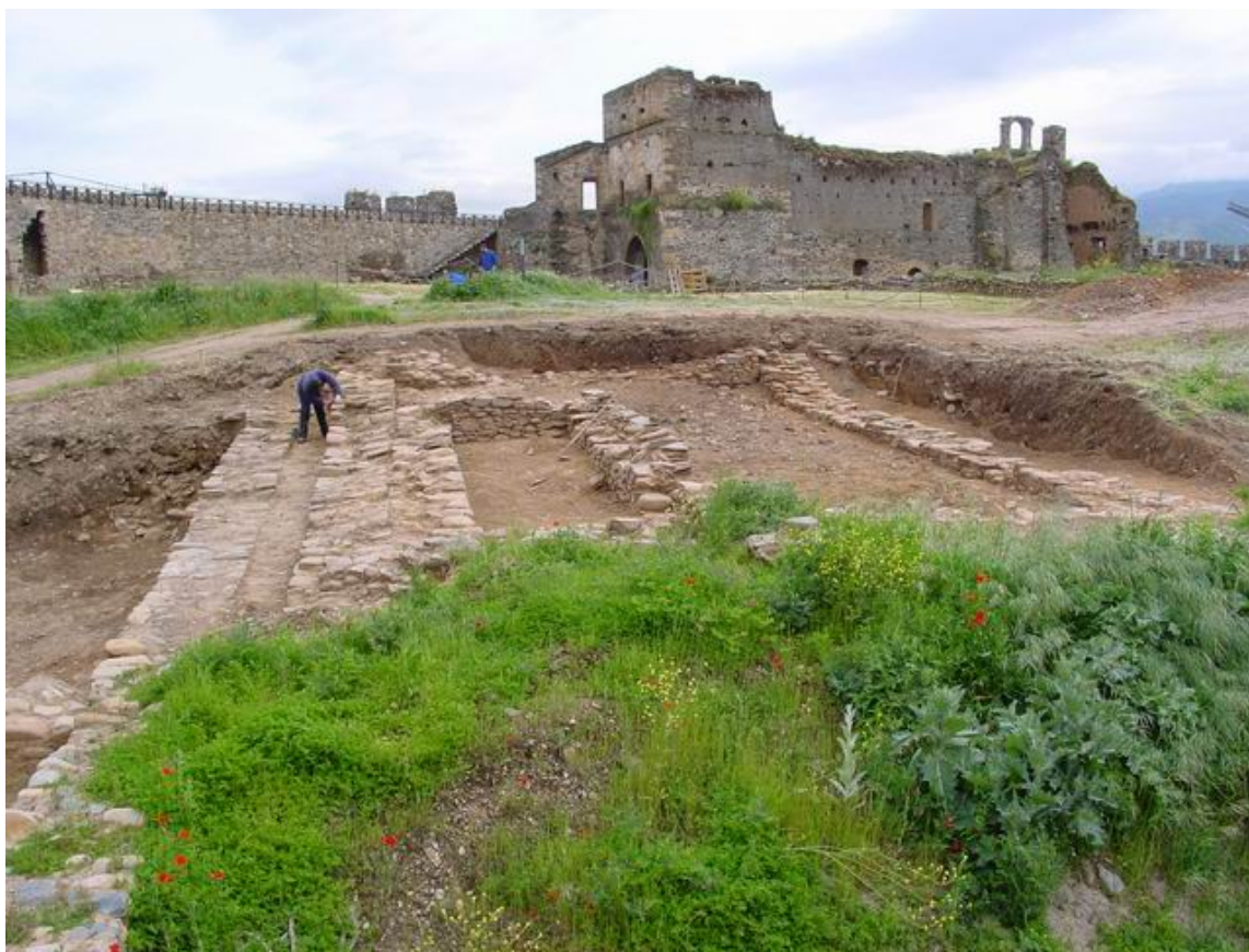
Figura 6. Área 4 desde la muralla del Sil.

Este sector abarcaba una amplia zona del interior de la antigua villa de Ponferrada, del llamado patio de Armas, entre la torre de Monclín y el Cubo Viejo o del Duque integrante del Castillo Viejo, y en paralelo a la muralla sobre el río Sil. Se trataba de una zona en la que ya antes de la intervención arqueológica eran visibles diversos muros de antiguas construcciones. Una vez realizada, se pusieron a la vista numerosas edificaciones que en su gran mayoría se encuadraron en una fase bajomedieval (Fig. 6).