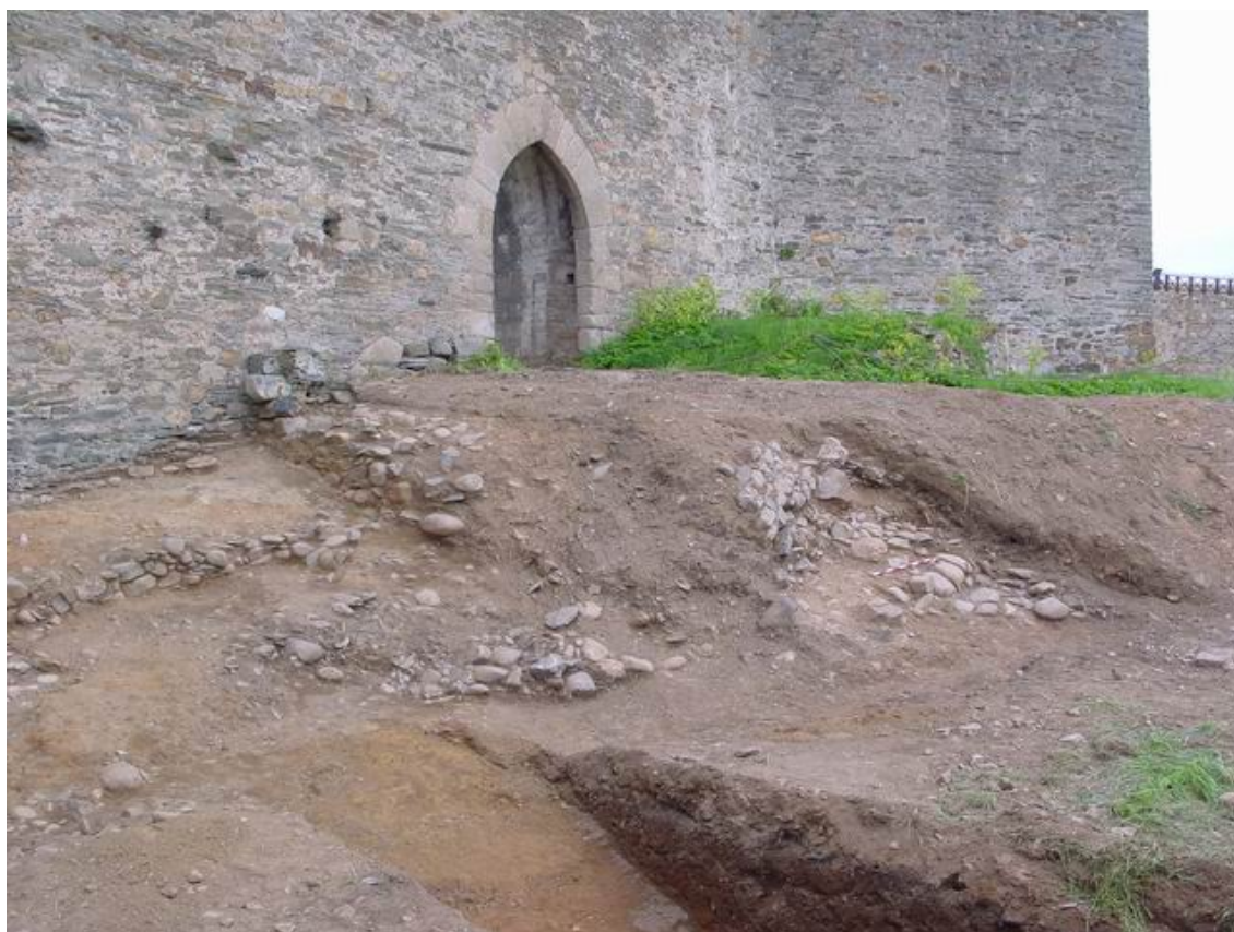
Figura 5. Área 7.

Se corresponde con una zona exterior al llamado Castillo Viejo, en torno a su puerta, y en donde se abría un foso que lo separaba de la villa amurallada de Ponferrada (Fig. 5).