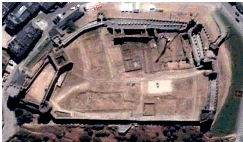
Figura 4. Vista cenital del castillo desde el Norte.