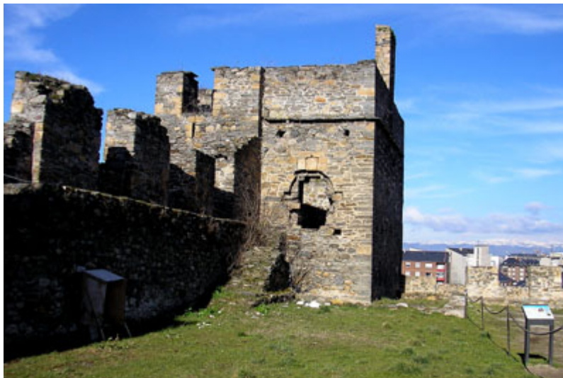
Figura 8. La torre de Monclín desde el interior del patio de Armas. Se observa la puerta de entrada en alto y algunos de los mechinales de la galería que la rodeaba por este frente.

Se trata del número que se dio a la zona de excavación del interior de la torre de Monclín, que es la que se sitúa en el ángulo N.O. del recinto amurallado de Ponferrada. Aparte de poseer una estructura muy interesante, con una puerta de entrada situada en alto o la posesión de una galería alta de madera por los dos costados que dan al interior de la fortaleza (Fig. 8), en esta torre destaca la inclusión en su interior del esquinazo de la antigua muralla del siglo XII. De grandes cantos de río unidos con barro, ésta se conservó en la planta baja y sirvió después como límite de dos espacios que se emplearon como almacenes de la nueva torre de Monclín (Fig. 9).