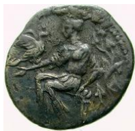
Fig. 10: Lira de Eryx (410 a.C. – 400 a.C.). ( http://www.acsearch.info/search.html?id=1297083 ).

Este dato es relevante en cuanto a que habría que buscar el origen de esta relación en la propia población ericina. Por un lado, Afrodita siempre ha estado vinculada a la procreación de la naturaleza 19 , de ahí el posible nexo entre la divinidad y la planta, un elemento vegetal de gran fertilidad y carácter perenne.