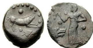
Fig. 13: Bronce de Halicias (415 a.C. – 400 a.C.). ( http://www.acsearch.info/search.html?id=1466865 ).