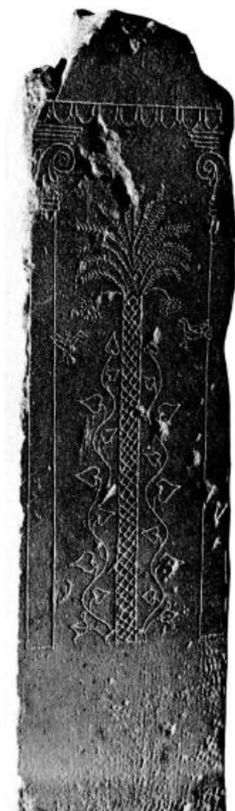
Fig. 11: Estela del tofet de Salammbô (siglo IV a.C.). (Museo de Bardo, Túnez).

dedicado a Baal y a Tanit 23 y perteneciente al siglo IV a.C., siendo el posible origen de la asociación al realizarse un sincretismo tanto a nivel de la divinidad como de sus atributos en el caso de la iconografía ericina.