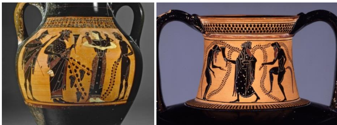
Fig.2: Cerámica ática bilingüe (575 a.C. – 525 a.C.) y Fig.3: Cerámica ática (Siglo VI a.C.) British Museum, London ( http://www.theoi.com/Olympios/Dionysos.html ).

En el caso de la relación de la hiedra con Dionisos en las acuñaciones griegas de Sicilia, la moneda de Naxos es el único ejemplo directo numismático en la isla, aunque también habría que incluir la moneda de Catania al representar al sileno, parte del cortejo del dios, coronado con hiedra. En el caso de Naxos, se puede ver la hiedra formando parte tanto de la corona que rodea la cabeza del dios (fig.4), en las acuñaciones que transcurren desde el último cuarto del siglo VI a.C. hasta finales del siglo V a.C., como también integrada en la decoración de la escena junto a un sileno (fig.5) en las acuñaciones del último cuarto del siglo V a.C.