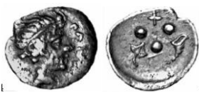
Fig. 19: Tetras de Solunto (408 a.C. – 407 a.C.). (Manganaro, Mikrá Kermata, plate V, n. 69).

aparecen asociados a su figura y culto en la moneda de las poblaciones vecinas de Hímera y Thermae Himerense 32 , así como la imagen de la caracola también está relacionada con la figura de las ninfas locales en la moneda de Hímera, Zancle-Mesana y Siracusa 33 .