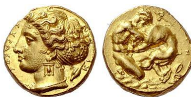
Fig. 9: Cien litras de oro de Siracusa (406 a.C. – 367 a.C.).

También en la moneda de Siracusa es posible ver una hoja de hiedra en el reverso de una de las cien litras de oro 15 del periodo 406-367 a.C. (fig.9) acompañando la imagen de Heracles luchando contra el león de Nemea, aunque al igual que en el caso de Hímera, habría que vincular la imagen de la hiedra con la ninfa local de Siracusa, cuya efigie aparece en el anverso de la moneda.