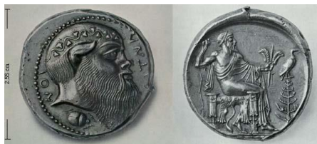
Fig. 6: Tetradracma de Catania 12 (Aetna) (476-466 a.C.).

( http://www.magnagraecia.nl/coins/Area_VI_map/Katane_map/descrKatH_033.html ).