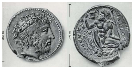
Fig. 5: Tetradracma de Naxos 11 (425 a.C. – 403 a.C.).

También, en la moneda acuñada por Catania en el periodo 476-466 a.C. bajo el nombre de Aetna (fig.6) podemos observar cómo la hiedra se relaciona con la imagen de Dionisos al aparecer representada en un tetradracma coronando la efigie del sileno, figura que formaba parte del cortejo del dios griego.