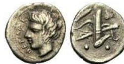
Fig. 20: Litra de Solunto (408-407 a.C.). ( http://www.acsearch.info/search.html?id=1466989 ).