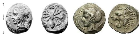
Fig. 7: Hemilitrón de Siracusa (466-415 a.C.) y Fig. 8: Litra de Hímera (472-409 a.C.)

Así como también podemos verla en forma de corona del propio Dionisos en una única serie de hemilitrones 13 del periodo 466-415 a.C. en sustitución de la típica efigie de la ninfa local de Siracusa, Aretusa (fig.7).