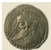
Fig. 4: Dracma de Naxos 10 (525 a.C. – 493 a.C.). (British Museum, London. Museum Number: RPK,p242C.2.Nax).

En el caso de la relación de la hiedra con Dionisos en las acuñaciones griegas de Sicilia, la moneda de Naxos es el único ejemplo directo numismático en la isla, aunque también habría que incluir la moneda de Catania al representar al sileno, parte del cortejo del dios, coronado con hiedra. En el caso de Naxos, se puede ver la hiedra formando parte tanto de la corona que rodea la cabeza del dios (fig.4), en las acuñaciones que transcurren desde el último cuarto del siglo VI a.C. hasta finales del siglo V a.C., como también integrada en la decoración de la escena junto a un sileno (fig.5) en las acuñaciones del último cuarto del siglo V a.C.