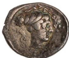
Fig.12: Didracma de Segesta (425 a.C. – 415 a.C.).

En ambos casos se puede ver como la figura de la ninfa local aparece acompañada por una hoja o rama de hiedra (Segesta)(fig.12), o, como en el caso de la moneda de Halicias (fig.13 y fig.14), la hoja de hiedra acompaña a la figura del jabalí, animal utilizado en las acuñaciones de las poblaciones de Sicilia como animal representativo de la fertilidad de la tierra 25 , asociado a la figura de las divinidades fluviales locales como en el caso de la moneda de Hímera (fig.15) y Abacaenon (fig.16).