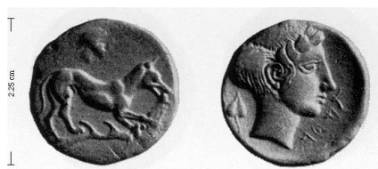
Fig.18: Didracma de Motia 29 (415/10 a.C. – 405 a.C.). ( http://www.magnagraecia.nl/coins/Area_III_map/Motya_map/dscrMotJ_1-0431.html ).

Por último, en el caso de las acuñaciones de Solunto, la hiedra aparece representada en el reverso de una única serie de tetras 30 de finales del siglo V a.C. (fig.19) acompañada por una caracola, y vinculada a la imagen de Pan, el cual aparece representado en el anverso.