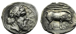
Fig. 16: Litra de Abacaenon (475 a.C. – 412 a.C.). ( http://www.acsearch.info/search.html?id=1466788 ).