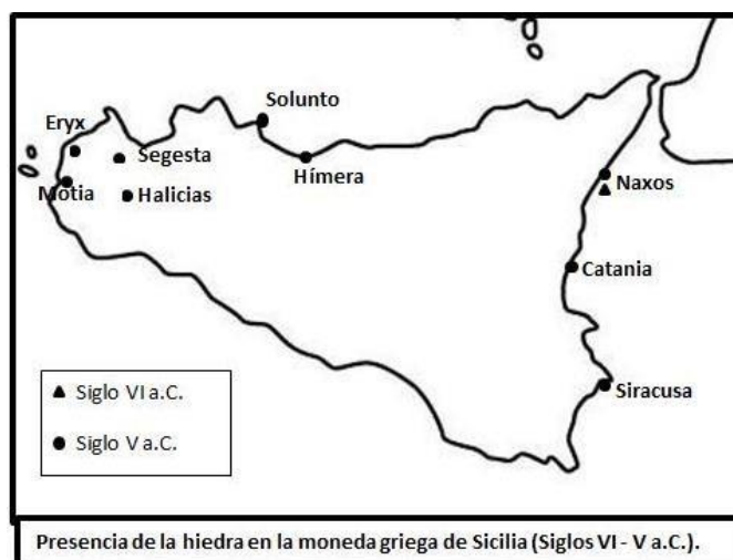
Fig.1: Mapa de representación de la hiedra en la moneda griega de Sicilia.

moneda de las poblaciones élimas de Eryx, Segesta y Halicias, donde además de aparecer relacionada con la representación de las ninfas locales también se vincula con la figura de Afrodita. Y por último, podemos observar la hiedra en la moneda de poblaciones púnicas como Motia a consecuencia de la copia de modelos iconográficos procedentes de las cecas élimas, así como en Solunto, donde aparece relacionada con la imagen de Pan.