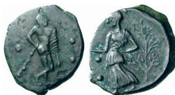
Fig. 14: Tetras de Halicias (415 a.C. – 400 a.C.) 26 . ( http://www.acsearch.info/search.html?id=249902 ).