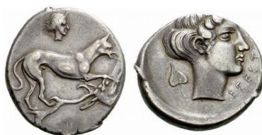
Fig.17: Didracma de Segesta 28 (415 a.C. – 397 a.C.).

Este hecho, unido a su asociación con la hiedra en las estelas citadas anteriormente del tofet de Salammbô, hace que se pueda interpretar esta efigie femenina de la moneda de Motia como la representación de Tanit.