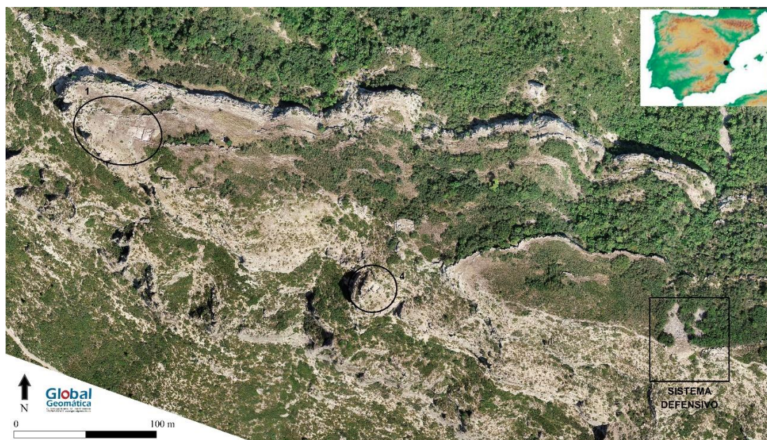
Figura 1. Ortofoto del yacimiento (2021), con los diferentes sectores excavados.

hasta el siglo XX cuando tengamos las primeras referencias de la existencia de un yacimiento llamado inicialmente “Cantarería de los Moros” (Gómez Serrano 1949; Fletcher Valls 1966), topónimo todavía conocido en la población de Yátova. La denominación de Pico de los Ajos, en relación con la abundancia de esta particular planta bulbosa silvestre, llegará a partir del descubrimiento que supone un punto de inflexión: los plomos con escritura PA-I, II y III. Hallados en 1979, estudiados y publicados por Domingo Fletcher Valls al año siguiente (1980), otorgarán fama al yacimiento, pero, al mismo tiempo, supondrán un aumento de las actividades clandestinas, alcanzando cotas gravemente altas. Derivado de esto, en parte, se sumará la publicación de otros tres plomos escritos, PA-IV, V y VI (Fletcher Valls 1982 y 1985; Tomás Ferre 1989). Gran cantidad de los materiales arqueológicos depositados en el Museo de Buñol provienen de esta infausta realidad.