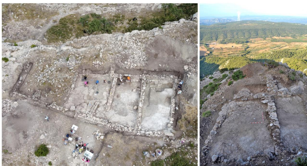
Figura 2. Vista del sector 1 a vuelo de dron durante el proceso de excavación en 2021 (1). Fotografía del final de la excavación del sector 4 en 2018 (2).