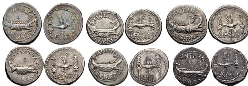
Diversas formas de las letras de las leyendas de los denarios legionarios de Marco Antonio.

Esta serie fue emitida entre el otoño del año 32 a.C. y la primavera del año 31 a.C. 12 , quizás en la ciudad y puerto aqueo de Patras 13 , en el norte del Peloponeso (periferia de Grecia Occidental), la base de operaciones de Marco Antonio, ya que haberlo efectuado en Actium era muy arriesgado. La uniformidad de tipo y estructura denota que su producción parece haber sido reducida (en principio) a una única área 14 . Evidentemente, la producción fue efectuada antes del enfrentamiento decisivo entre ambos bandos 15 .