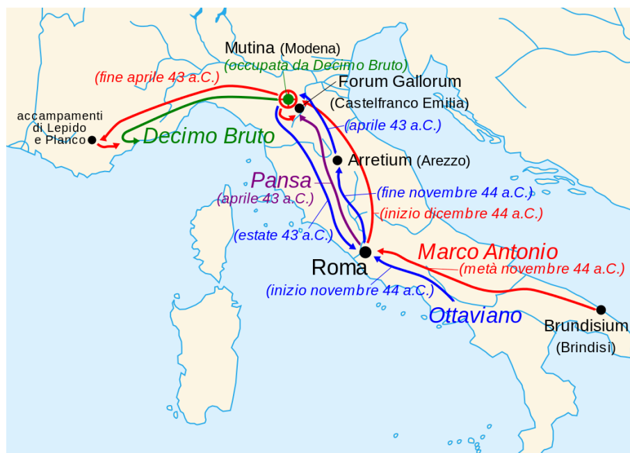
Movimiento de las legiones durante la guerra de Mutina (44-43 a.C.).

había avanzado un centenar de millas en dirección suya para que viniera lo antes posible—, Antonio saco dos legiones, la Segunda y la Trigesimoquinta, y dos cohortes pretorianas, una, la suya y otra, la de [M. Junio] Silano, y además una parte de los veteranos reenganchados” (Cic. Fam. 10, 30, 1) 30 . A señalar que el numeral más alto conocido corresponde a la legio XXXXI (CIL XI 4650 y 4654 = ILS 2230-2231), quizás reclutada en el año 41 a.C. 31