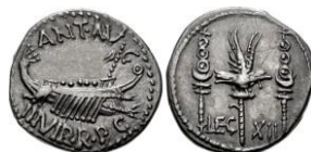
Curioso denario en que la letra G de AVG del anverso ha quedado separada del resto de la palabra por el mástil (RRC 544/26) 34 .

De esta forma, P. A. Brunt critica a W. W. Tarn quien, en base a la existencia de estas monedas, supuso que, aparte de las legiones atestiguadas en Actium y en la Cirenaica, Marco Antonio también dispondría de tropas en Macedonia, Siria y Egipto, con objeto de no dejar desguarnecidas estas provincias fronterizas 35 , aunque el primer estudioso citado presenta varios ejemplos de ello, al menos de fuerzas legionarias 36 . Por tanto, es forzoso concluir que si el denario que presentamos es auténtico, de lo que la casa Classical Numismatic Group, Inc. (CNG) no alberga dudas, o la serie “legionaria” de Marco Antonio fue interrumpida en su producción por la presencia del ejército de Octaviano, por lo que se conservarían pocas piezas a partir del numeral veintitrés, lo que no parece muy probable, o estos denarios fueron fabricados para las nuevas fuerzas que Marco Antonio estaba reuniendo tras el desastre de Actium , teoría más plausible 37 . Se mantendría la tipología de las anteriores emisiones en un afán de transmitir continuidad.