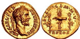
Áureo de Septimio Severo (RIC IV 14).

Otras amonedaciones que copiaron el reverso de la serie legionaria de Marco Antonio fueron acuñadas por los postreros emperadores Clodio Albino (193 d.C.), Septimio Severo (193-211 d.C.), Caracalla (198-217 d.C.), Heliogábalo (218-22 d.C.), Galieno (253-268 d.C.), Constantino I, el Grande (303-337 d.C.), Maximino Daya (310-313 d.C.), Licinio I (308-324 d.C.) y Alejandro de Cartago (308-311 d.C.).