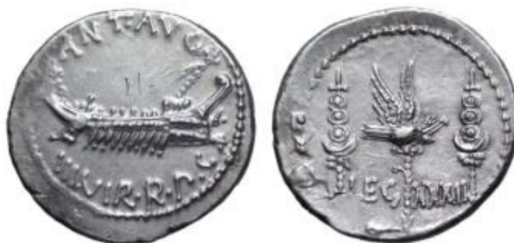
Moneda con la legio XXXIII ampliada.

momento 19 . Este es un caso diferente, ya que se documenta por primera vez una legión totalmente desconocida y que abre de nuevo el debate sobre la composición del ejército del famoso triunviro.