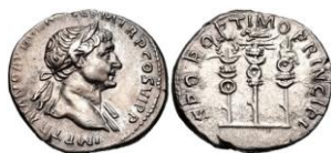
Denario de Trajano (RIC II 295).

Otras amonedaciones que copiaron el reverso de la serie legionaria de Marco Antonio fueron acuñadas por los postreros emperadores Clodio Albino (193 d.C.), Septimio Severo (193-211 d.C.), Caracalla (198-217 d.C.), Heliogábalo (218-22 d.C.), Galieno (253-268 d.C.), Constantino I, el Grande (303-337 d.C.), Maximino Daya (310-313 d.C.), Licinio I (308-324 d.C.) y Alejandro de Cartago (308-311 d.C.).