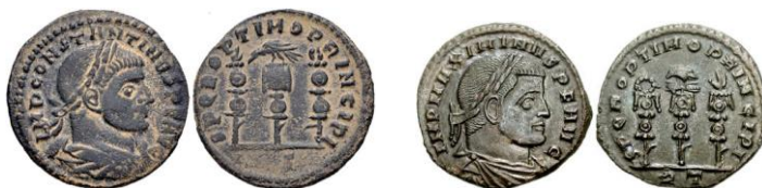
Follis de Constantino I (RIC VI 351a) y de Maximino Daya (RIC VI 350b).