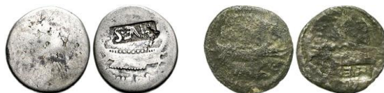
Denarios contramarcados de Marco Antonio en época de Vespasiano, en Éfeso, durante los años 74-79 d.C. 72

Posteriormente, encontramos estas monedas contramarcadas en tiempos de Vespasiano (69-79 d.C.) 68 , y si bien Trajano (98-117 d.C.) retiró de la circulación los denarios de época republicana, por demasiado pesados (de hecho, todos aquellos acuñados antes de la reforma de Nerón), mantuvo en vigor la serie “legionaria” de Marco Antonio 69 : éstas monedas no fueron objeto de una “restauración” simplemente por el hecho de que seguían en el circulante. Unos cien años después, aparentemente con objeto de celebrar el bicentenario de la batalla de Actium , Marco Aurelio (161-180 d.C.) y Lucio Vero (161-168 d.C.) restauraron los tipos legionarios de Marco Antonio en una remarcable emisión de denarios, años 168-169 d.C. 70 , en concreto, la LEG VI 71 .