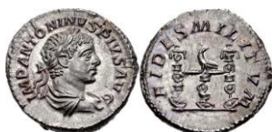
Denario de Heliogábalo (RIC IV 78).