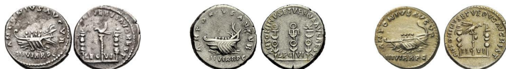
Denarios de Marco Aurelio y Lucio Vero (RIC III 443).

Esta tipología siguió siendo popular aún sin celebrar ocasiones conmemorativas. Fue un pilar de los cistóforos imperiales en Asia Menor, y los tres emperadores flavios acuñaron bronce medios con la tipología del reverso inspirada por este diseño. Trajano (98-117 d.C.) la utilizó para las monedas de todos los metales. Cuadrantes “anónimos” con esta tipología fueron también acuñados, así como por parte de Adriano (117-138 d.C.) (cuya emisión de ca. el año 118 d.C. puede conmemorar el 150 aniversario de Actium ) y Antonino Pío (138-161 d.C.).