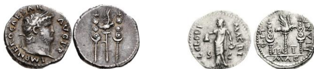
Denarios de Nerón (RIC I 68) y de Clodio Mácer (RIC I 20).

d.C.) 67 y por algunos que acuñaron las monedas anónimas que se denominan “de las Guerras Civiles”.