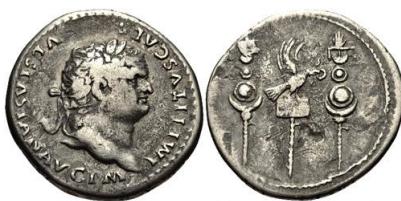
Tetradracma cistofórico de Tito (RIC II 516 = RPC II 861).