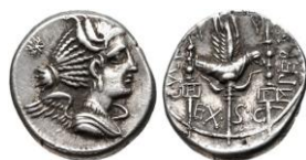
Denario de C. Valerio Flaco emitido en Massalia (RRC 365/1a).

Marco Antonio comenzó la presente emisión de monedas en el año 32 a.C., justamente 50 años después de que el imperator C. Valerio Flaco ( cos. 93 a.C.) produjera una emisión de denarios (RRC 365/1) con un diseño de reverso que muchos investigadores piensan que fue el prototipo del icónico diseño del reverso de esta serie 64 . Esta tipología, que presenta un águila legionaria entre dos estandartes legionarios, fue posteriormente reciclada en varias ocasiones. La presente serie permaneció en circulación durante muchas décadas, hasta la época de los Severos 65 , teniendo una gran popularidad, como lo muestra el hecho de que fue imitada por diversos emperadores 66 .