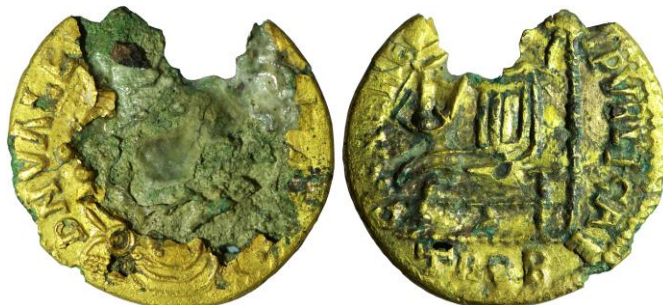
Figura 1. Fracción de solidus de Nuestra Señora de Uralde acuñada en cobre y forrada de oro. Al doble de su tamaño.

ocasionar la futura urbanización de los terrenos en los que se encuentra el yacimiento de Uralde, se documentaron dos fases de utilización del citado vertedero (Filloy y Gil 1993: 125, 145-147, 151-153). Un primer momento, de ocupación más intensa, fechado en período altoimperial y un segundo datado en época bajoimperial. Es precisamente en este segundo instante cuando se perdió el ejemplar objeto de estudio (Figura 1).