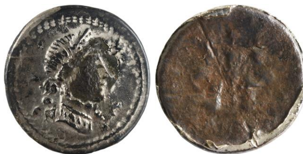
Figura 3. Denario de Julio César del yacimiento de Andagoste (Jokano, Álava). Al doble de su tamaño.