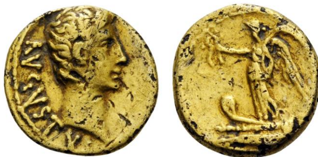
Figura 6. Quinario a nombre de Augusto realizado en cobre y forrado de oro. Al doble de su tamaño.

Si seguimos a estos dos investigadores, la mencionada técnica de dorado o plateado al fuego no se generalizó en el Imperio Romano hasta la cuarta centuria de nuestra era (Botrè y Hurter 2000: 109-110). Aún y todo, se ha reportado la aparición en Palestina de dos antoninianos de Caracalla y Heliogábalo, datados entre los años ca. 215-220 d. C. (Botrè y Hurter 2000: 110), en los que se documentaron trazas de mercurio y oro sobre la superficie de ambos ejemplares.