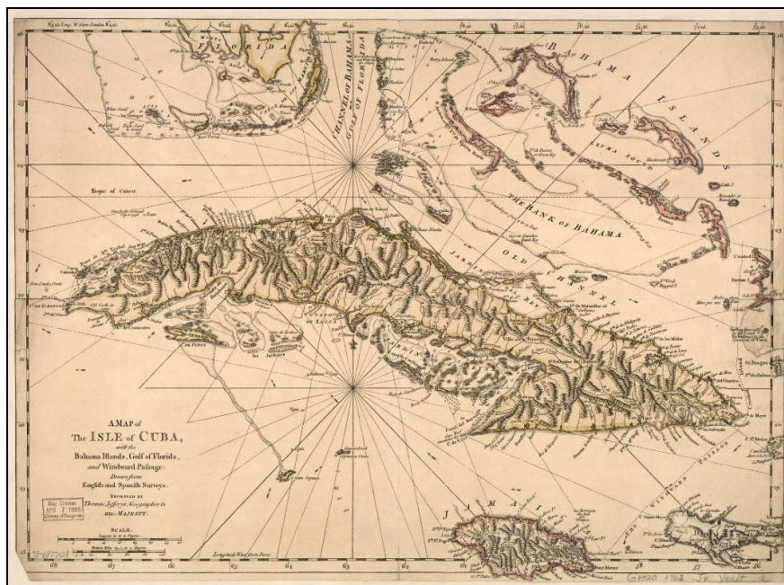
Fig. 1. Mapa de la Isla de Cuba encontrado en la Biblioteca del Congreso de los Estados Unidos (1762). Título original del mapa: “ A map of the isle of Cuba, with the Bahama Islands, Gulf of Florida, and Windward Passage: Drawn from English and Spanish surveys ” 1 .

Las fuentes auríferas en Cuba comenzaron a disminuir y ello coincidió con la fundación de las primeras casas de la moneda en América (cecas): la de México en 1535 y la de Santo Domingo 1542, por Orden Real del Emperador Carlos I de España. Fue durante el reinado de Felipe II, cuando por Real Cédula de 1556 arribaron a la Isla las embarcaciones españolas con las primeras remesas monetarias en metálico, procedentes de las cajas reales de México conocidos como el Situado Mexicano (Rodríguez Escandell 2018).