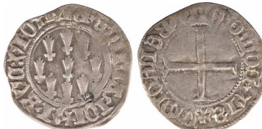
Figura 9. Jean V, duque de Bretaña, blanca nueva emitida en Rennes.

Los señores fabrican monedas que muchas veces son una evolución respecto de tipos monetarios establecidos con mucha antigüedad, aunque la variedad es la regla. En algunos casos, como el siguiente ejemplar acuñado entre 1399 y 1411 en Bretaña, aparecen las armas del duque de Bretaña.