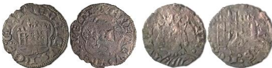
Figura 1. Media blanca y cornado de Enrique III procedentes de la excavación.

Además, en espacio distinto apareció una blanca acuñada a partir de 1471 sin contramarcas. El objeto de esta colaboración es analizar el hallazgo desde una perspectiva numismática, histórica y económica de las monedas contramarcadas. Con esta finalidad, se pondrán inicialmente de manifiesto los presupuestos jurídicos, técnicos históricos y arqueológicos para a continuación deducir la atribución, significado y alcance de este llamativo numerario.