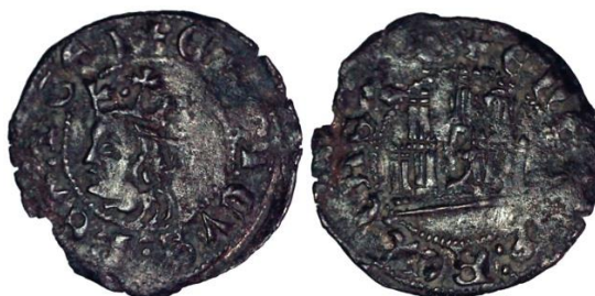
Figura 3. Cornado emitido tras 1369. Imagen del autor.

El diseño del busto, idéntico a otras series descritas en el mismo ordenamiento, permite atribuir cómodamente a las emisiones de 1369 una serie de cornados distinta a los hallados en San Marcial 8 .