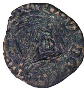
Figura 6. Contramarca en forma de M gótica en la parte central de una blanca de 1471.

No tenemos muchas certezas sobre estas contramarcas. Su cronología puede establecerse entre 1471 (inicio de la última emisión de Enrique IV) y 1497 (comienzo de la primera de los Reyes Católicos, cuyas monedas carecen de contramarcas). Algunas de estas marcas guardan importantes semejanzas a las empleadas en algunas cecas en el período posterior a 1468 y a las usadas por plateros en algunas localidades entre los años finales del s. XV y los primeros del s. XVI. En ausencia de datos más específicos, puede suponerse que se realizasen por plateros locales.