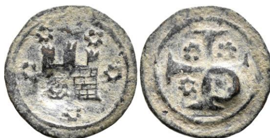
Figura 8. Follis con contramarca de Quíos, finales del siglo XIV.

Aunque sea a modo de referencia, indicar que no conocemos en la Francia de los siglos XIV y XV, de la que era originario Jean de Béthencourt, ninguna mención a moneda contramarcada. Es preciso viajar al Mediterráneo oriental para encontrar un referente para comparar. Es el caso de la sociedad Maona en la isla griega de Quíos, de la que conocemos algunas contramarcas realizadas en los años finales del siglo XIV.