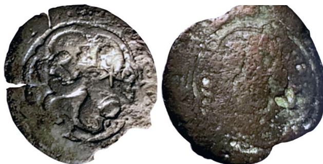
Figura 7. Contramarcas de Lanzarote.

1581 y 1611 24 Todas estas contramarcas se realizan para su uso local y ninguna guarda semejanza con las conocidas en San Marcial.