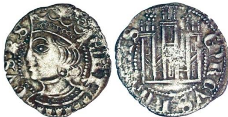
Figura 4. Cornado emitido tras 1373.

Puestas así las cosas, hay dos series conocidas de cornados cuya atribución se ha discutido por ser en abstracto atribuibles a Enrique II o bien a Enrique III. Unos de ellos muestran el busto del rey de lado o de frente, tienen una apariencia rica en plata y se fabricaron en Burgos, Córdoba, A Coruña, Santiago, Sevilla, Toledo y Zamora. Nadie duda de su atribución a las series de 1373 tanto por la semejanza con los cornados anteriores a 1366 como por la presencia de casas de moneda que fabrican otras series de las señaladas en las cortes de ese año, en particular, los dineros de vellón. 12