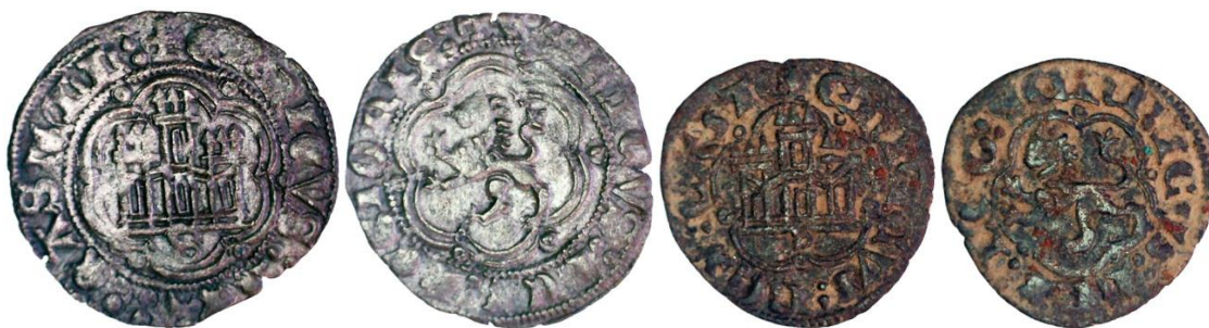
Figura 2. Blanca y media blanca acuñadas en Sevilla tras 1391.

De acuerdo con esta descripción, los reales, con el tiempo denominados blancas, deben pesar 2'09 g, de los que 0'39 g son de plata. Su descripción no deja ocasión a la duda en relación con la atribución de una serie adaptada a esta descripción y que se fabrica en las casas de moneda de Burgos, A Coruña, Cuenca, Sevilla y Toledo 6 . También en Sevilla se acuñan medias blancas, con la mitad de las dimensiones de las unidades a las que pertenecen los ejemplares ahora analizados.