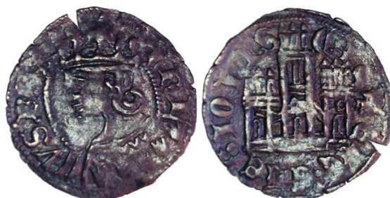
Figura 5. Cornado cobrizo sin marca de ceca.

Sin embargo, la otra serie se forma por cornados con una apariencia cobriza en la que el manto bajo el busto del rey tiene en ocasiones siete escudetes y que se fabrica en Burgos, A Coruña, Cuenca, Sevilla y Toledo 13 . Esta segunda serie -la presente en San Marcial- es la que exige la atención en este punto.