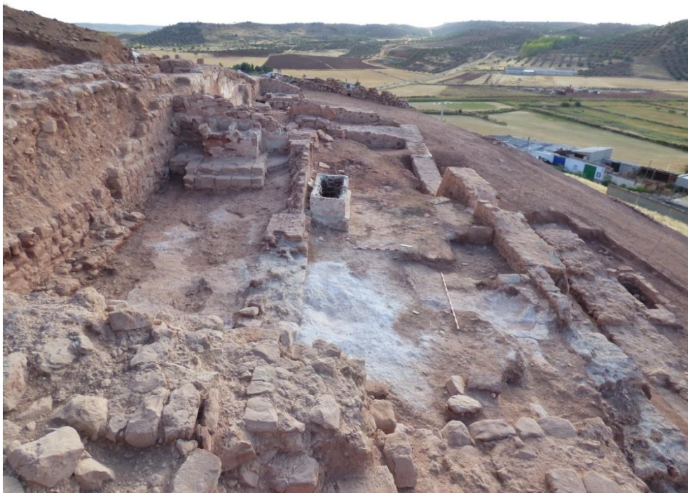
Espacio interior de la iglesia con el nivel de uso donde se localizó la pieza.

Ha sido en este templo, oculto hasta el inicio de las campañas arqueológicas en 2012, donde se halló el cornado de Santa Orsa . La iglesia se ubica en el Sector 1 del yacimiento y se ha ido excavando en diversas campañas hasta el año 2017, momento en que se ha iniciado el proyecto de musealización de los restos. Este edificio presenta la peculiaridad de que se vino abajo a principios del siglo XVI, cuando ya se había convertido en ermita, al construirse la nueva parroquia en la llanura en la que actualmente se ubica la población de Montiel (iglesia de San Sebastián). Este hecho ha permitido que se convirtiera en un magnífico contenedor arqueológico donde la estratigrafía medieval se halla muy bien conservada, lo que nos ha permitido realizar interesantes hallazgos como los restos del archivo parroquial, pinturas murales, varios sarcófagos, alguno de ellos con rica decoración heráldica, elementos arquitectónicos decorativos y ajuars variados, como pulseras de pasta vítrea, anillos, monedas, vasos litúrgicos, etc. (Molero y Gallego, 2017 y 2018; Peña, 2018).