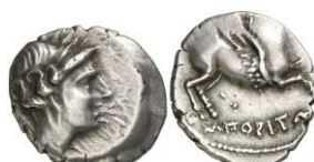
ACIP 225 = CNH 78. AR. Dracma. 16/17 mm (13 ejemplares) 23 . Dos puntos. Anv.: Similar al anterior. Rev.: Similar al anterior, pero entre pegaso y leyenda dos puntos.