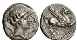
ACIP 224 = CNH 77 (Amorós VII). AR. Dracma. 16/17 mm 22 . Anv.: Cabeza femenina a dra. de tamaño pequeño, cuello largo y estrecho, alrededor tres delfines. Rev.: Pegaso con cabeza modificada a dra. Debajo, inscripción griega ΕΜΠΙΟΡΙΤΩΝ.