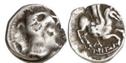
ACIP 214 = CNH 66. AR. Dracma. 16/17 mm (5 ejemplares) 12 . Símbolo A. Anv.: Similar al anterior. Rev.: Pegaso con cabeza modificada a dra. Debajo, inscripción griega ΕΜΠΙΟΠΙΤΩΝ. Entre leyenda y pegaso, símbolo A.