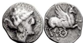
ACIP 222 = CNH 69. AR. Dracma. 16/17 mm (18 ejemplares) 20 . Símbolo corona. Anv.: Similar al anterior. Rev.: Similar al anterior, pero símbolo corona