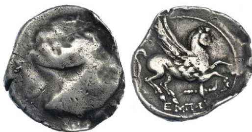
Dracma ligera de Emporion ACIP 221 (ampliado x 2)

Si bien desde un punto de vista metalográfico la plata continuó siendo de gran pureza y con valores medios muy semejantes a los de periodos anteriores, pero la presencia de elementos minoritarios, sobre todo cobre y plomo, es mucho más irregular. Es posible que las técnicas metalúrgicas de fundición y refinamiento del metal que se efectuaban en este momento fueran menos cuidadas que las utilizadas para las emisiones de dracmas del siglo III a.C. De esta forma, Emporion sigue utilizando la misma ley, pero sin obtener la misma regularidad que en las emisiones precedentes 48 .