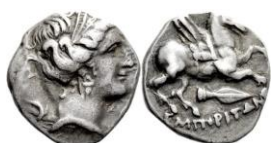
ACIP 223 = CNH 74. AR. Dracma. 16/17 mm (14 ejemplares) 21 . Símbolo punta de lanza. Anv.: Similar al anterior. Rev.: Similar al anterior, pero símbolo punta de lanza