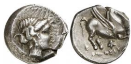
ACIP 226 = CNH 79. AR. Dracma. 16/17 mm (11 ejemplares) 24 . Símbolo abeja. Anv.: Similar al anterior. Rev.: Similar al anterior, pero símbolo abeja.