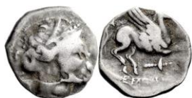
ACIP 221 = CNH 67. AR. Dracma. 16/17 mm (10 ejemplares) 19 . Símbolo antorcha. Anv.: Similar al anterior. Rev.: Similar al anterior, pero símbolo antorcha