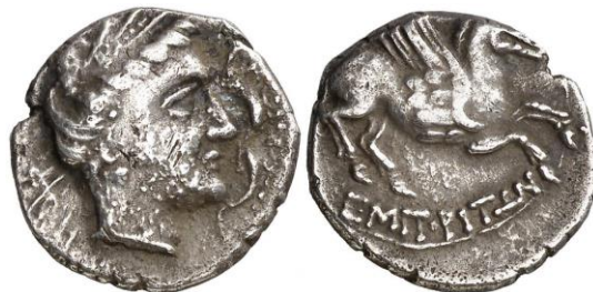
Dracma ligera de Emporion ACIP 210 (ampliado x 2)

Los cuños de los Grupos V, VIA y VIB se graban con cuidado con lo que se producen ejemplares de calidad, pero ya con el Grupo VI C-D el arte pierde delicadeza. A la vez que se introduce en diversos reversos una novedad: la utilización de símbolos o letras, como: un círculo, un delfín, una clava, una punta de lanza, una mosca, un pulpo, una antorcha o una punta de lanza, más las letras alpha y delta 44 ; este hecho muy posiblemente se deba por la influencia de las primeras series de denarios romanos, en las que la identidad de los magistrados monetales se representó mediante símbolos y letras.