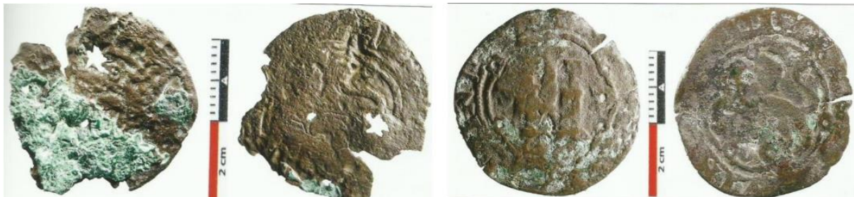
Figura 1: Anverso y reverso de las monedas de cobre reselladas, encontradas en Tenerife (Fuente: García González, 2020).

El autor del presente trabajo postula que el resello “de estrella” presente en los cuartos de cobre hallados en Tenerife se trataría en realidad del resello “de roseta” aplicado al mismo tipo de monedas para habilitar su circulación en la isla de Cuba. Estas piezas habrían sido llevadas a continuación a Tenerife junto con otras procedentes de Santo Domingo.