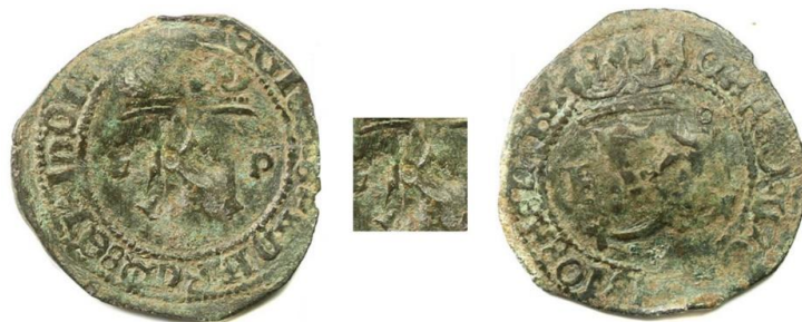
Figura 2: Anverso y reverso de una moneda resellada de cuatro maravedís acuñada en Santo Domingo a nombre del Rey Carlos V y su madre Juana.

anterioridad y en la mayoría de estas últimas el resello era apenas visible. Según el citado documento las monedas también correrían en la isla a razón de once por real de plata.