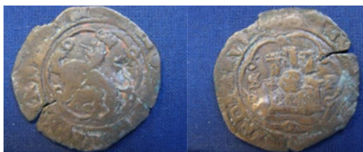
Figura 3: Anverso y reverso de otra moneda resellada de cuatro maravedís acuñada en Santo Domingo.

Las monedas reselladas a partir de 1613 para su uso en Cuba correspondieron al tipo que en ese momento circulaban en Santo Domingo (Fonsalba, 1938). Es decir, los cuartos de cobre que exhibían en el anverso un castillo y un león en el reverso, ambos inscritos dentro de sendas orlas lobuladas. En este sentido se conocen varias piezas de este tipo que exhiben el resello cubano de “roseta”, al que también podríamos definir como una estrella de cinco o seis puntas.