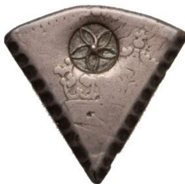
Figura 4: Fragmento de moneda de ocho reales usado en Curazao con resello de roseta.

Nos referimos a la contramarca también en forma de roseta estilizada que fue aplicada sobre piezas recortadas de ocho reales de plata para ajustar su valor en reales. Como ha quedado ampliamente demostrado (Calicó, 1968), dicho resello no está vinculado en absoluto con Cuba sino que fue empleado a partir del año 1800 en la isla caribeña de Curazao. El uso de esa contramarca fue bastante generalizado allí en especial durante el período de ocupación inglesa de la isla. En julio de 1814 el gobernador inglés ordenó que se cortasen 8000 monedas de plata de ocho reales en cinco trozos cada una, las cuales fueron marcadas con el citado resello. Como Calicó correctamente recalca en su artículo, esta contramarca es fácilmente diferenciable de la aplicada en Cuba ya que las monedas sobre las que fueron estampadas son claramente diferentes y el resellado se produjo en épocas distintas.