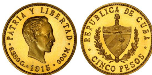
Figura 4: Anverso de una moneda de oro de cinco pesos acuñada en 1915.

Una proposición de ley presentada en el Congreso el 19 de agosto de 1939 por el líder del Partido Unión Nacionalista, Marino López Blanco, recomendaba utilizar las monedas de oro cubanas depositadas en la Tesorería como garantía para una nueva emisión de “certificados plata”. La cantidad de monedas almacenadas, por valor de poco más de un millón de pesos, era todo lo que quedaba en Tesorería de los más de 23 millones de pesos en monedas de oro cubanas acuñadas entre los años 1915 y 1916. La mayor parte de estas monedas había emigrado fuera del país, principalmente a plazas europeas, nada más salir a la circulación debido a las perturbaciones económicas ocasionadas por el estallido de la Primera Guerra Mundial. Muy pocas consiguieron ser retenidas por la Tesorería General al ser finalmente desmonetizadas en 1934 (fig. 4).