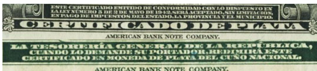
Figura 7: Leyendas presentes en el anverso (arriba) y reverso (debajo) de los certificados plata con valores nominales de quinientos y mil pesos.

Si bien la convertibilidad en monedas de plata se mantuvo invariable, el fondo de garantía de estos billetes quedó constituido por dólares y oro en barras. Como ya se ha mencionado, este cambio no quedó reflejado en las leyendas grabadas en los billetes de cien pesos y menor denominación. Con lo cual, los mismos no se ajustaban a la legalidad. El error solo fue subsanado en los billetes de quinientos y mil pesos (fig. 7), quizá debido al hecho de que los mismos fueron impresos por un establecimiento distinto (“American Banknote Company”) al que realizó desde 1934 hasta 1949 las impresiones de los “certificados plata” de denominaciones inferiores (“Bureau of Engraving and Printing”).