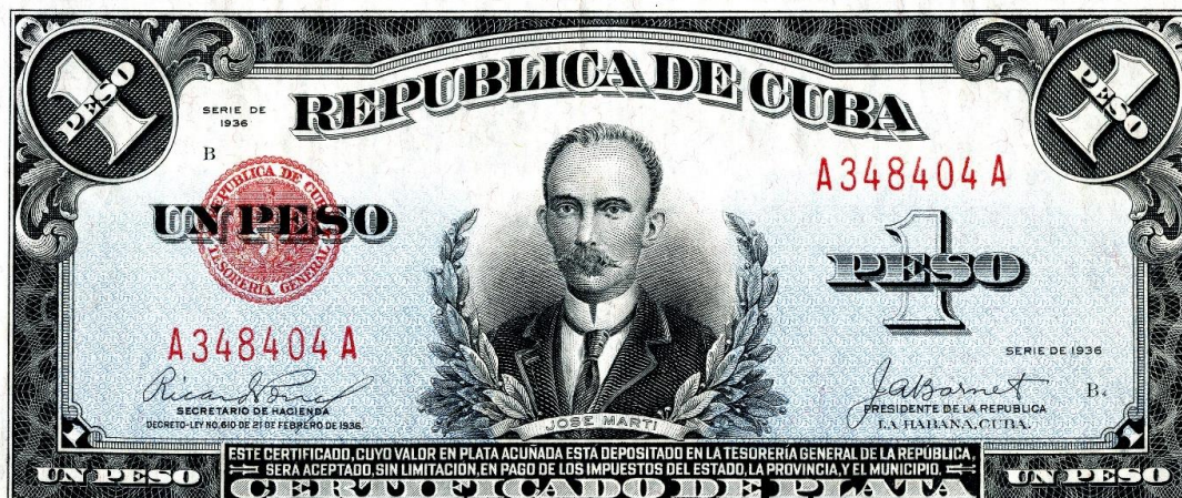
Figura 1: Anverso de un “certificado plata” de un peso de la serie de 1936.

indaga en los distintos mecanismos de conversión que fueron implementados a lo largo del tiempo.