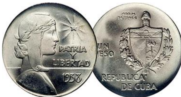
Figura 2: Anverso y reverso de una moneda de un peso “ABC” acuñada en 1938.

La circulación de monedas de plata de un peso acarrea demasiosos problemas debido al gran peso y volumen de las piezas. Esta medida permitía sustituirlas por un signo monetario más conveniente y acorde a los tiempos. Al mismo tiempo el estado pasaba a controlar toda la reserva de plata impidiendo así que esta pudiese emigrar a otras naciones en caso de estallido de una crisis económica o un conflicto bélico.