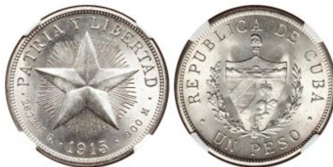
Figura 3: Anverso y reverso de una moneda de un peso de la serie “Estrella Radiante” acuñada en 1915.

Los restantes doce millones de pesos en billetes serían en cambio emitidos gradualmente a medida que se fuesen retirando igual suma en las monedas cubanas de plata de un peso que en esos momentos se encontraban en circulación. Estas eran las piezas correspondientes a las acuñaciones realizadas entre 1915 y 1933 por un total de 12.4 millones de pesos correspondientes a la serie “Estrella Radiante” (fig. 3). Se estimó que con que esto serían retiradas de la circulación virtualmente todas las monedas de plata de un peso teniendo en cuenta que un número de ellas habían sido ya retiradas a lo largo de los años por su mal estado.