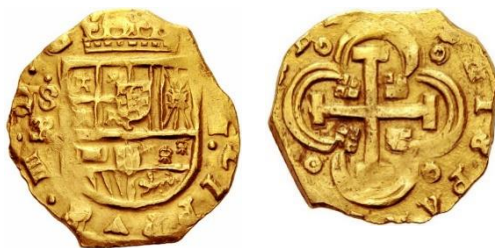
Figura 4. Cuarta moneda. 8 escudos. Felipe IV. Sevilla \exists R . (Tauler 80).

4ª Moneda. 8 escudos. Felipe IV. Sevilla \exists R (Tauler 80). Utilizada para comparación (Figura 4).