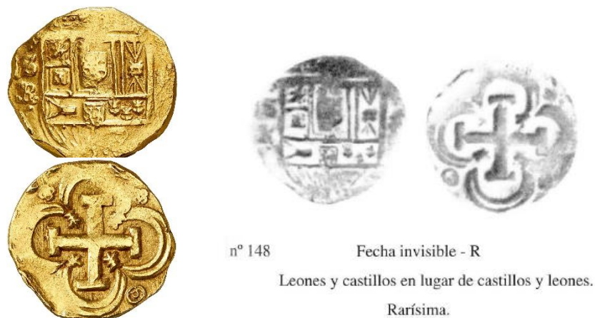
Figura 1. Moneda objeto del estudio: 8 escudos. Carlos II 1666 Sevilla R (CalOnza 148/Tauler 148).

La moneda bajo estudio ha sido comparada con otras cuatro pertenecientes al periodo de Felipe IV. Las referencias de las monedas son las que proporcionan los catálogos de la bibliografía: La Onza (CalOnza) y Oro Macuquino (Tauler). Tres de las monedas aparecen en ambos catálogos, aunque una de ellas, la 3ª, no tiene el mismo número de referencia en ambos catálogos 1 .