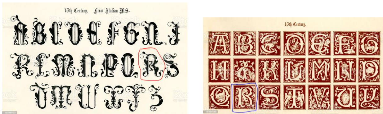
Figura 6. Láminas que ilustran los adornos de las letras iniciales de línea en sendos manuscritos del siglo XVI.