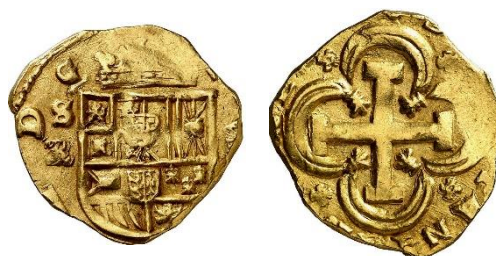
Figura 2. Segunda moneda. 8 escudos. Felipe IV. Sevilla ER (Tauler 78).

1ª Moneda. 8 escudos. Carlos II 1666. Sevilla R (CalOnza 148/Tauler 148/AC 1003) (3). Es la moneda objeto del estudio (Figura 1).