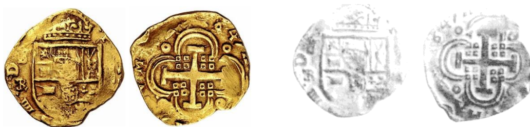
Figura 3. 3ª Moneda. 8 escudos. Felipe IV. Sevilla ER (CalOnza 79/Tauler 79).

2ª Moneda. 8 escudos. Felipe IV. Sevilla ER (Tauler 78). Utilizada para comparación (Figura 2).