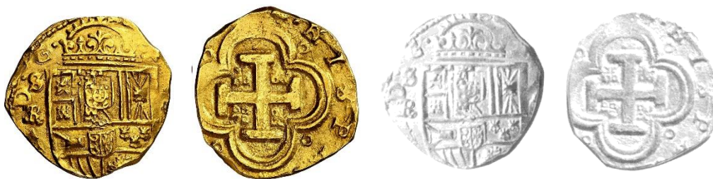
Figura 5. Quinta moneda. 8 escudos. Felipe IV. Sevilla \exists R . (CalOnza 80/Tauler 81).

4ª Moneda. 8 escudos. Felipe IV. Sevilla \exists R (Tauler 80). Utilizada para comparación (Figura 4).