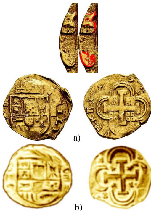
Figura 9. a) 8 escudos. Felipe IV. Sevilla 1649 R (Tauler 81a). Ceca visible, ensayador parcialmente visible; b) 8 escudos Felipe IV. Sevilla (CalOnza 99/Tauler 99). Fecha, ceca y ensayador invisibles.

Lo verdaderamente curioso de este ensayador, junto con el uso de la letra R carolina, es la inversión de castillos y leones que presentan los cuarteles de Castilla y León en el cantón diestro del jefe. Resulta además que esta inversión en la ceca de Sevilla, durante el reinado de Felipe IV, no se presenta con ningún otro ensayador, excepto quizás por dos ejemplares de ensayador desconocido (véase Figura 9).