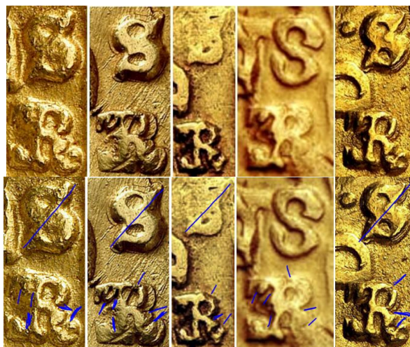
Figura 8. Comparativa visual de las cecas y ensayador para las 5 monedas.