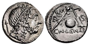
Denario de Cn. Cornelio Léntulo Marcelino (RRC 393/1a)

reverso de la emisión RRC 393/1 de Cn. Cornelio Léntulo Marcelino ( cos. 56 a.C.), efectuada en la década de los años 70s, inspiraría el reverso de la presente moneda 68 . Una vez más, la referencia es al Dictador, no al monetario, y refleja la esperanza de que con la reciente victoria de César sobre los pompeyanos en Thapsus (45 a.C.), la paz y la prosperidad puedan restablecerse ahora tras la interrupción de tres años de conflicto civil 69 .