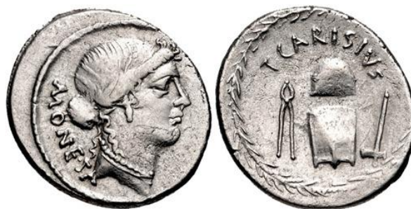
Denario RRC 464/2 (ampliado x 2)

una referencia a la posición de Carisio en la ceca 54 o a las reformas efectuadas por César en el taller monetario 55 que entró en vigor en el año 44 a.C.