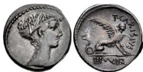
- RRC 464/1. AR. Denario.

Por lo que a nosotros nos interesa, la serie del magistrado T. Carisio fue emitida en la ceca de Roma durante el año 46 a.C. 8 Su descripción en la siguiente: