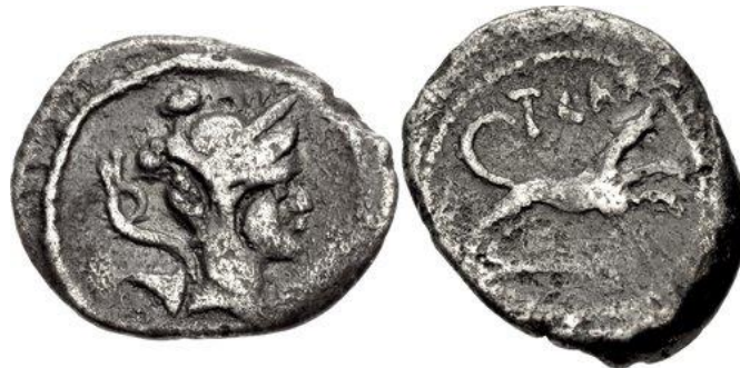
Sestercio RRC 464/8a (ampliado x 3)

Por el contrario, los tipos de los sestercios se concentran en honrar a las principales deidades del panteón romano 75 , un tema más destacado en las monedas del colega de Carisio, Rufo, pero que ya comienza a documentarse a inicios del año 47 a.C. 76 De esta forma, en RRC 464/7 una cabeza barbuda del acompañante de Baco, Sileno (generalmente identificado como Pan) aparece en combinación con una pantera, el animal sagrado para el dios del vino 77 ; mientras que en RRC 464/8 Diana aparece en el anverso en su papel de cazadora con su sabueso representado en el reverso 78 .