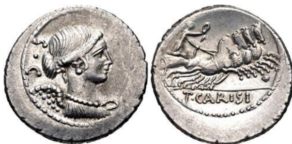
Denario RRC 464/5 (ampliado x 2)

Los denarios RRC 464/4-5, que presentan a la diosa de la victoria tanto en el anverso como en el reverso, celebran claramente el reciente éxito de César en la campaña africana que, junto con sus conquistas anteriores, estaba a punto de ser celebrado en el triunfo cuádruple 70 . La segunda versión, que agrega la fórmula SC ( senatus consulto ) al diseño del anverso, parece indicar un complemento de emergencia a la producción de denarios de Carisio 71 , necesaria por la necesidad urgente de César de suministros adicionales de moneda con los que pagar a sus veteranos 72 .