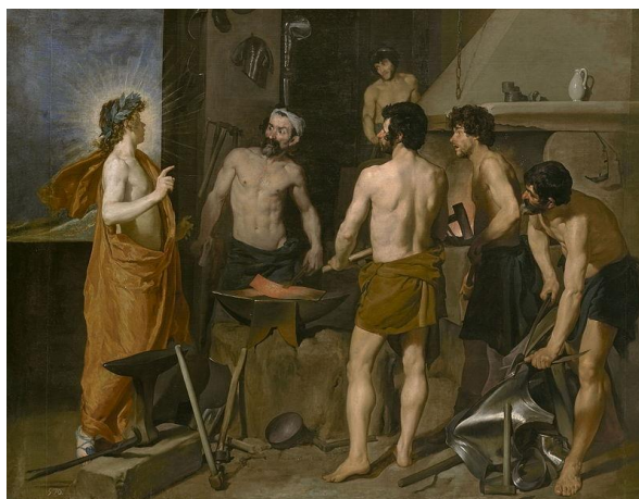
“La fragua de Vulcano” de Diego Velázquez, 1630 (Museo de El Prado. Madrid).