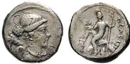
Quinario RRC 464/6 (ampliado x 2)

Es otro eslabón más de una asociación particular entre César y la res publica , tal como en su momento sugirieron así mismo las emisiones de L. Cornelio Sila ( cos. I 88 a.C.) y los silanos 74 .