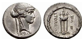
Denario de L. Manlio Torcuato (RRC 411/1b)

En realidad, la figura del anverso es simplemente la cabeza de la esfinge en el reverso 48 , como puede observarse en piezas de este denario bien conservadas, a partir de su peinado, algo que los estudiosos anteriores habían pasado por alto 49 . En un principio, la utilización de la esfinge por el monetario pudiera deberse a que hiciera alusión a su cognomen , quizás Balbus (“uno que habla oscuramente”) 50 , como acontece en varios casos del periodo. Por otro lado, se ha hipotetizado que la esfinge fuese el sello personal de César 51 . En sus inicios, el emperador Augusto tenía un sello con una esfinge, que había heredado de su madre, la sobrina del Dictador (Plin, NH 37, 10. Cf. Dio Cass. 51, 3, 6. Suet. Aug. 50), por lo que puede existir una conexión entre este animal fantástico y César 52 , pero que, por desgracia, no conocemos su significado.