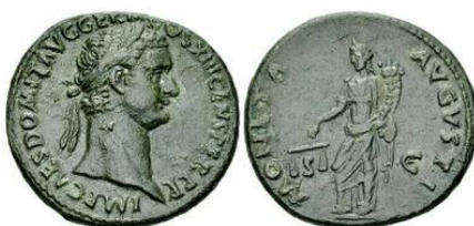
As de Domiciano del año 87 d.C. (RIC II 547)

La iconografía del denario RRC 464/3 simboliza el dominio mundial ejercido por Roma, que se extiende tanto por tierra como por mar, como se representa claramente en el reverso, la primera por el cetro del magistrado, el segundo por el timón del barco; y la prosperidad universal disfrutada bajo su benéfico gobierno (el de César, evidentemente) indicada por el cuerno de la abundancia encima del globo celestial 67 . El