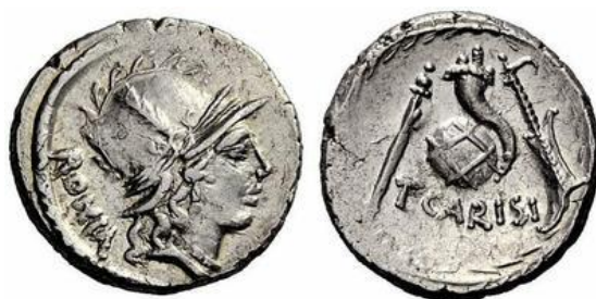
Denario RRC 464/3a (ampliado x 2)

Los denarios RRC 464/4-5, que presentan a la diosa de la victoria tanto en el anverso como en el reverso, celebran claramente el reciente éxito de César en la campaña africana que, junto con sus conquistas anteriores, estaba a punto de ser celebrado en el triunfo cuádruple 70 . La segunda versión, que agrega la fórmula SC ( senatus consulto ) al diseño del anverso, parece indicar un complemento de emergencia a la producción de denarios de Carisio 71 , necesaria por la necesidad urgente de César de suministros adicionales de moneda con los que pagar a sus veteranos 72 .