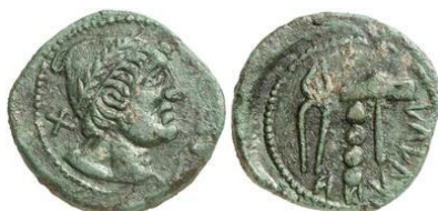
Triente de Populonia, ca. los años 215-211 a.C. (HGC 1 183 = ICC 140). En el anverso aparece el dios Sethlans (= Vulcano) con un píleo y en el reverso tenazas y martillo.

defendió ya en su día H. A. Grueber 61 , y que figura en algunas monedas de Aesernia , Ariminum o Populonia 62 , así como su representación figura en monedas y plomos monetiformes de Hispania 63 .