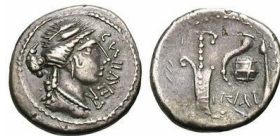
Denario híbrido de origen dacio con el anverso de RRC 428/1 y el reverso de RRC 464/3 (Davis A, II; website M265) 43

La tipología de las monedas de Carisio son ciertamente inusuales 34 . En un principio, el tipo atractivo del denario RRC 464/1 se creía que pretendía aludir (y alabar) a César al mencionar el supuesto origen troyano de los gens Iulia (a través de Venus y Eneas) 35 , con la cabeza de la Sibila 36 , cuya cualidad oracular estaría simbolizada por esfinge 37 , que de manera tradicional se ha interpretado como su animal heráldico 38 . A. Alföldi vio en la Sibila una nueva época de felicidad y un nuevo saeculum 39 , aunque esta interpretación estaría más de acorde tras la muerte de César 40 . También pudiera tratarse de que el personaje en cuestión fuese miembro de los XVviri 41 , uno de los cuatro collegia mayores con funciones sacerdotales de Roma, que, en particular, guardaban los Libros Sibilinos, pero esta afirmación ha sido igualmente negada 42 .