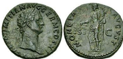
As de Domiciano del año 85 d.C. (RIC II 303)

Sea como fuere, la identificación del busto anverso como Juno se ha cuestionado, debido a que no presenta el habitual stephane de la Reina de los Olímpicos y esposa de Júpiter. Aunque acompañada por uno de sus antiguos títulos de moneta , de moneo (“advertir, aconsejar”), es muy probable que para esta época Moneta fuera una personificación menor por derecho propio. La misma personificación se puede ver en el reverso de la emisión de Domitianis Moneta Augusti aes de tiempos del emperador Domiciano (81-96 d.C.), que celebra la reapertura de la ceca después del incendio del año 81 d.C.