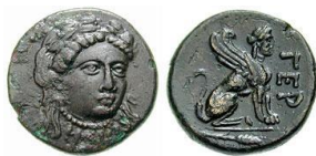
Bronce de Gergis, siglo III a.C. (SNG Copenhagen 339-340)