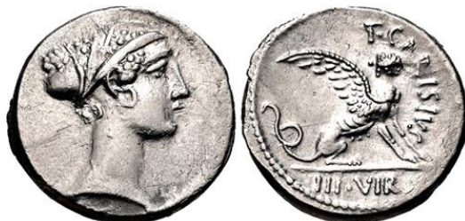
Denario RRC 464/1 (ampliado x 2)

En realidad, la figura del anverso es simplemente la cabeza de la esfinge en el reverso 48 , como puede observarse en piezas de este denario bien conservadas, a partir de su peinado, algo que los estudiosos anteriores habían pasado por alto 49 . En un principio, la utilización de la esfinge por el monetario pudiera deberse a que hiciera alusión a su cognomen , quizás Balbus (“uno que habla oscuramente”) 50 , como acontece en varios casos del periodo. Por otro lado, se ha hipotetizado que la esfinge fuese el sello personal de César 51 . En sus inicios, el emperador Augusto tenía un sello con una esfinge, que había heredado de su madre, la sobrina del Dictador (Plin, NH 37, 10. Cf. Dio Cass. 51, 3, 6. Suet. Aug. 50), por lo que puede existir una conexión entre este animal fantástico y César 52 , pero que, por desgracia, no conocemos su significado.