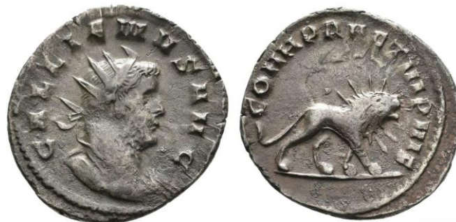
Fig. 1: Antoniniano proveniente de The Digital Coin Cabinet of Eichstätt University 135 (de https://numid.ku.de/object?id=ID141 ).

entre sus patas, asociado, como hemos visto, a Hércules (1 tipo) 42 , a las legiones IV, VII y IX (5 tipos diferentes) 43 , a las cohortes pretorianas VI y VII (3 tipos) 44 , a unas titulaturas imperiales concretas (4 tipos) 45 y a las iniciales S P Q R (1 solo tipo) 46 (Fig. 1).