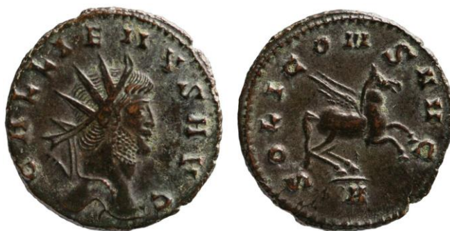
Fig. 2: Antoniniano proveniente del Münzkabinett Wien RÖ 19768 (de https://www.ikmk.at/object?id=ID71878 ).

Los siguientes 3 animales más representados en la numismática de Galieno, con 11 tipos diferentes y 12% del total cada uno, son el Pegaso, el capricornio y el toro. El Pegaso aparece en los reversos de diversas formas, de pie, galopando, saltando hacia el cielo o, incluso, volando, y lo hace asociado a Apolo (1 tipo) 51 , a Sol (5 tipos) 52 , a las legiones I y II (3 tipos) 53 , y, por último, a la leyenda ALACRITATI (2 tipos) 54 (Fig. 2).