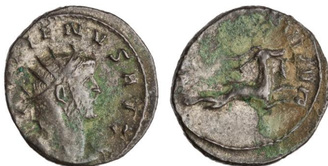
Fig. 3: Antoniniano de plata proveniente de la American Numismatic Society 1944.100.30331 (de http://numismatics.org/collection/1944.100.30331 ).